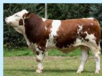
MASIV Pp Sikora