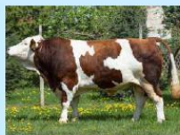
HEVIN BB Burek